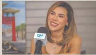
Marina del Pilar Ávila Olmeda presenta esta semana su Tercer Informe de Gobierno.